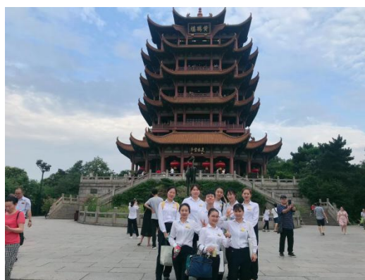
（学生比赛在黄鹤楼公园进行礼仪与讲解训练）